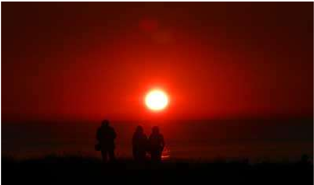
Sunset in Kampen