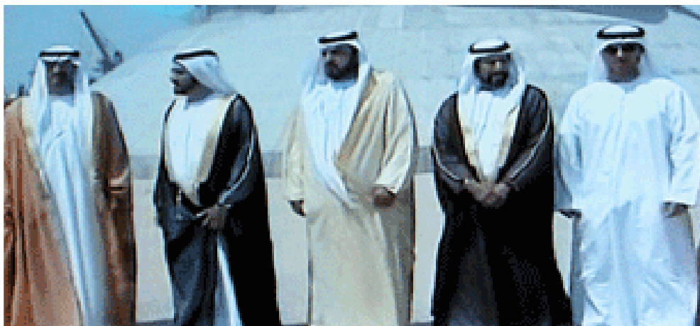
Die Herrscher der Vereinigten Emirate am Fuße des Burj Khalifa