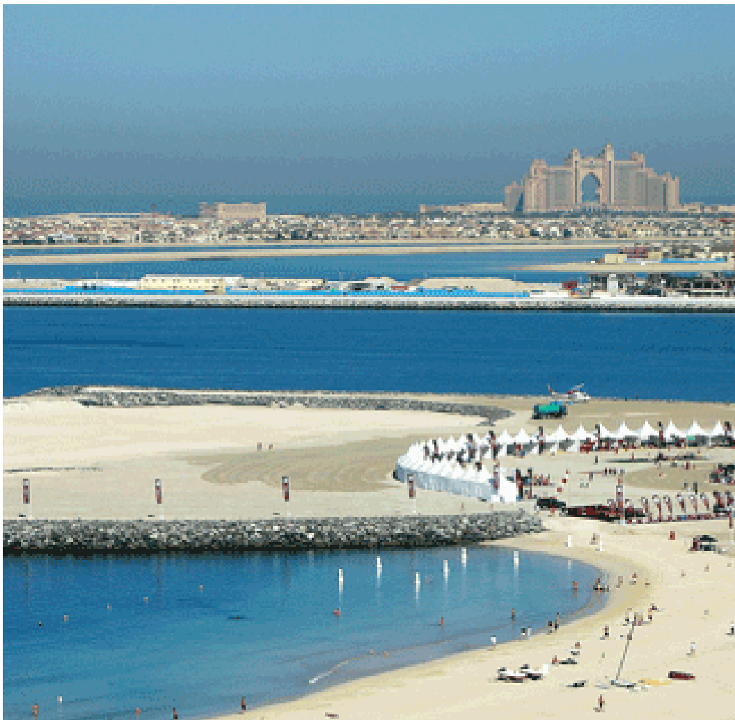
Blick vom Royal Meridien zum Beach und Hotel Atlantis