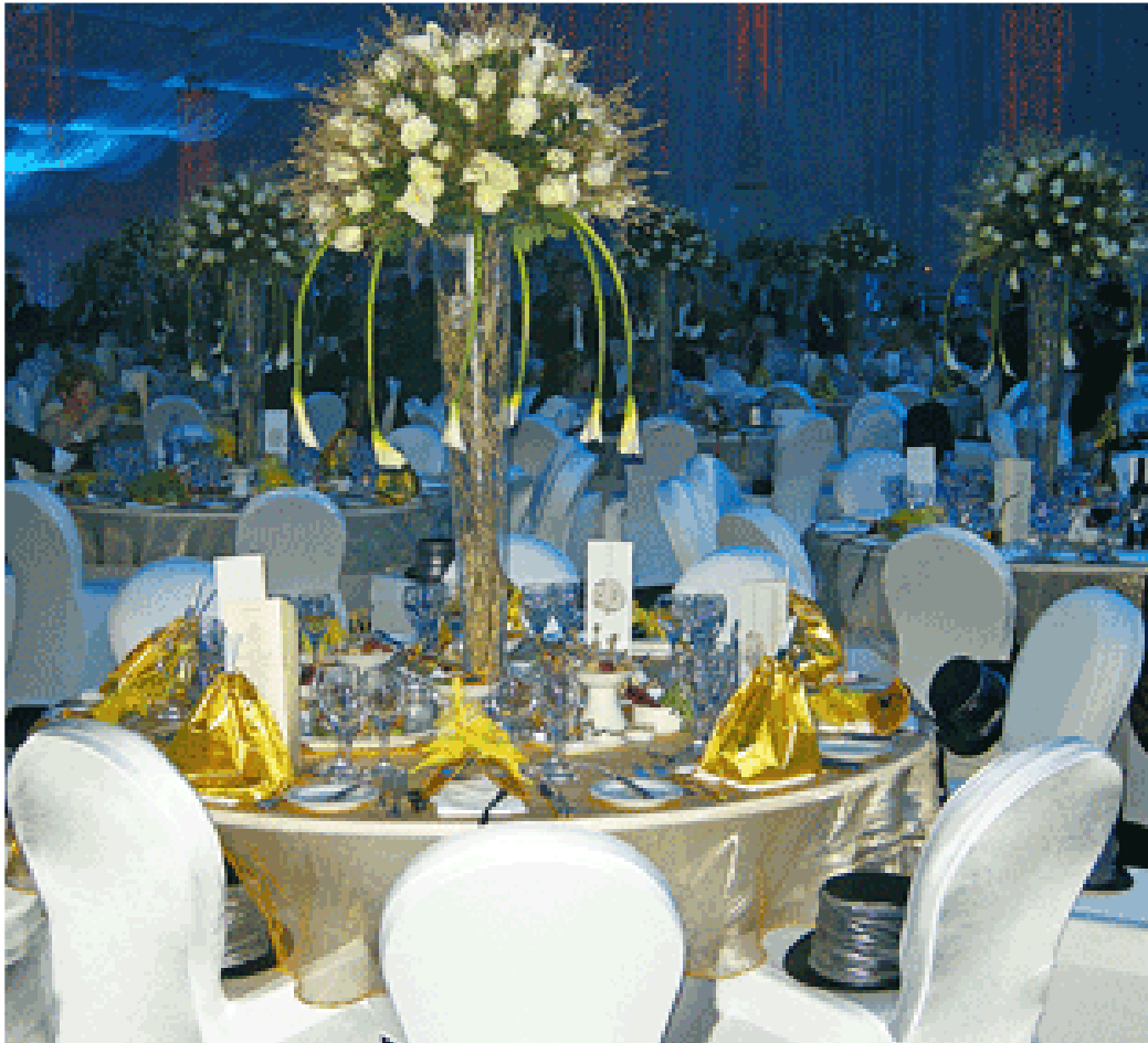
Zur Silvester-Gala im Royal Meridien festlich eingedeckt