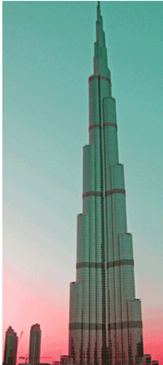
Burj Khalifa in Dubai: The world's tallest building ...und die ganze Welt staunt!