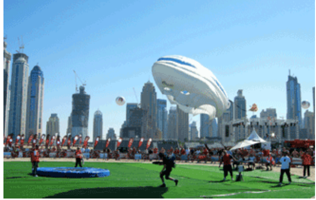
Fallschirmspringer- WM am Jumeirah Beach und Kunstflug-Show