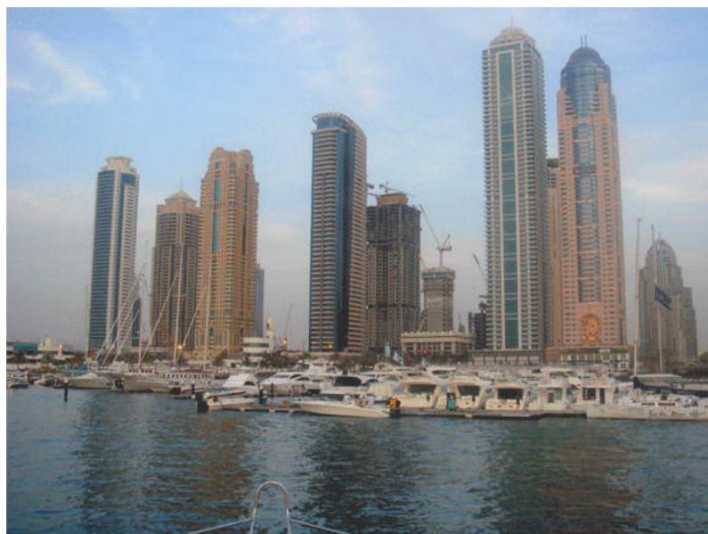
Drei von diesen Wolkenkratzern in Dubai Marina gehören Monas geschäftstüchtigem „Prinzen“