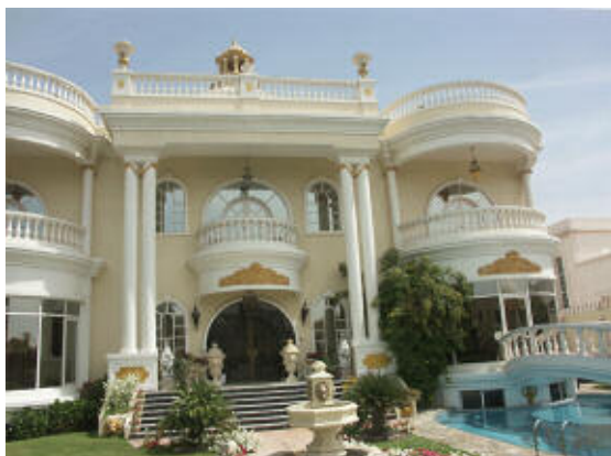
Am Morgen nach der VIP-Party ist die Villa wieder „besuchsbereit“, dank der 10 Mona ständig zur Verfügung stehenden „fleißigen Palast-Geister“