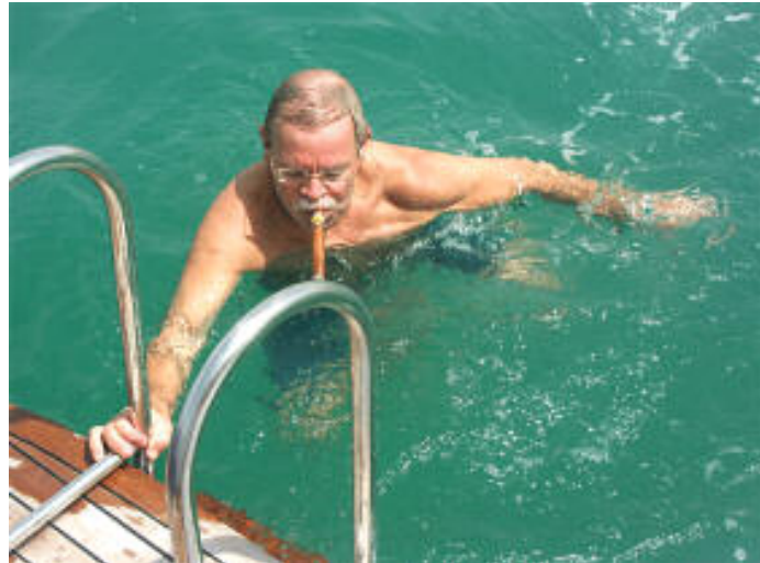
Fishermans Glück: Klassen ging einer von 5 Barrakudas an die Angel .....und der deutsche Botschafter ging baden... mit dicker Zigarre