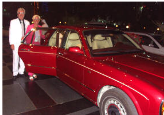
VIP-Shuttle für die Dortmunder Landsleute mit Monas Rolls Royce