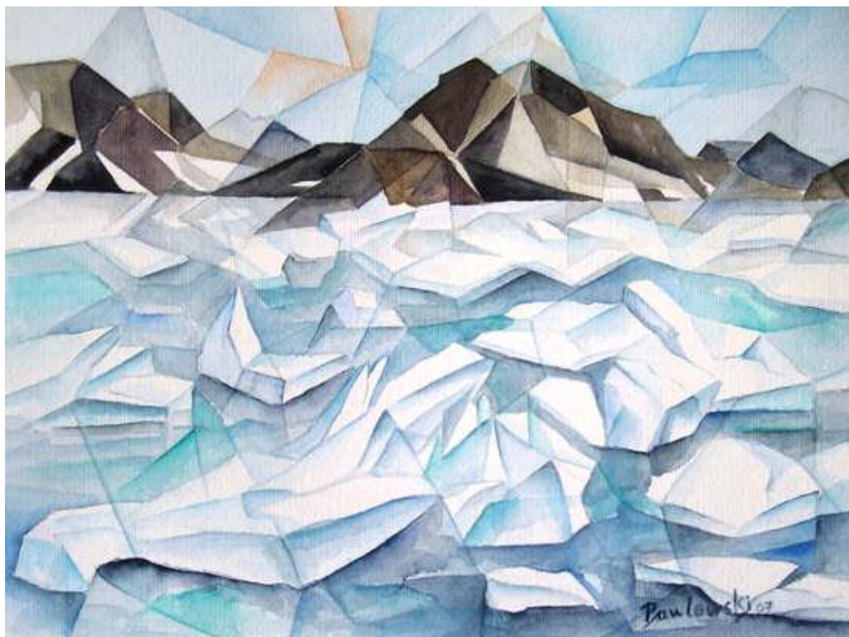
Eisberge – vom Maler kubistisch gesehen